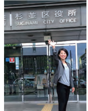
9月議会も傍聴に来てね～