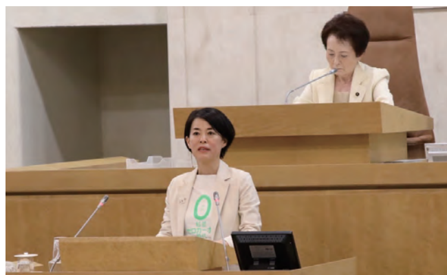
6/1一般質問で壇上に立ち、緊張しました!

環境部長の答弁:国を上回る基準設定について研究を進める。 区営住宅も積極的に断熱化を進めていく。